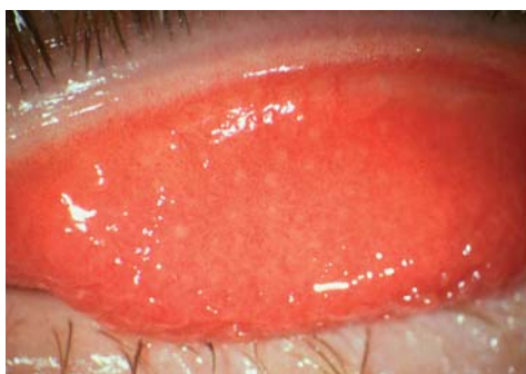
Abb. 3: Chlamydieninfektion

zu dem er intime Kontakte pflegt, mitbehandelt werden, damit die Infektionskette unterbrochen wird. Die systemische (= "Tabletten") Therapie der Chlamydieninfektion ist konsequent und über mindestens 3 Wochen durchzuführen, denn nur unter dieser Voraussetzung kann die chronische Bindehautentzündung mit den Riesenfollikeln (Ansammlung von weißen Blutkörperchen) abheilen. Das ist auch deshalb wichtig, weil bei Verschleppen dieser Erkrankung Dauerschäden an der Hornhaut und der Innenseite des Oberlides drohen.