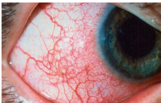
Abb. 1: Bindehautentzündung

Die subjektiven und die für den Laien erkennbaren objektiven Symptome sind bei allen Erscheinungsformen der Bindehautentzündung gleich oder sehr ähnlich, so dass sie allein keinen Aufschluss über die jeweilige Ursache geben.