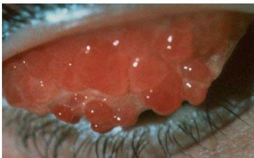
Abb. 5: Gigantopapilläre Konjunktivitis als Beispiel für eine allergische Erkrankung

befriedigend beherrscht werden können. Während bei der Heuschnupfen-Konjunktivitis die Zusammenarbeit mit einem Allergologen zur evtl. Desensibilisierung sinnvoll ist, hat eine solche Maßnahme bei der Frühjahrs-Konjunktivitis und bei der Konjunktivitis der Ekzematiker erfahrungsgemäß keine Erfolgsaussicht. Die therapeutische Kunst des Augenarztes besteht bei diesen letztgenannten eher chronischen Bindehautentzündungen darin, den Patienten mit einem Minimum an wirksamer Therapie beschwerdefrei zu halten, ohne unerwünschte Nebenwirkungen zu riskieren. Der Patient sollte verstehen, dass es sich bei dieser Erkrankungsgruppe um sog. konstitutionelle Leiden handelt, die therapeutisch wirksam gemildert, aber nicht vollständig ausgeheilt werden können, da die Veranlagung ererbt und unveränderlich ist.