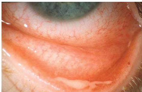
Abb. 2: bakterielle Konjunktivitis